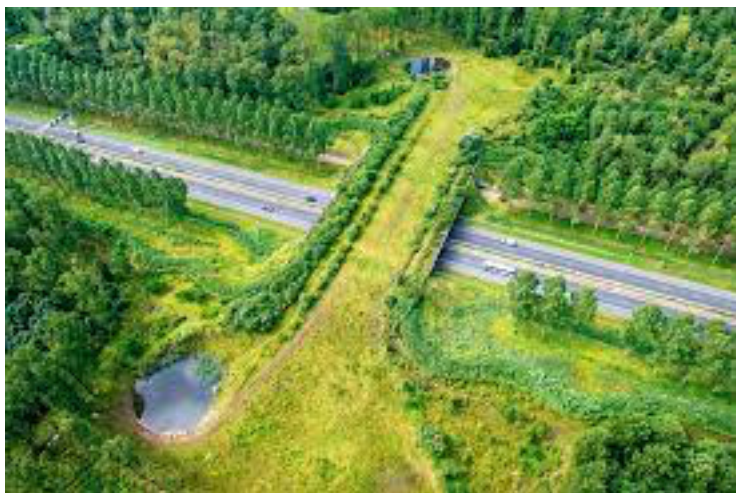
Corredor ecológico urbano

Felizmente a consciência da sociedade para este problema tem vindo a aumentar. Já são várias as estratégias para tentar travar este declínio: desde a criação de corredores ecológicos que atravessam as cidades, à restauração dos habitats silvestres que envolvem os campos agrícolas e a redução do uso de pesticidas.