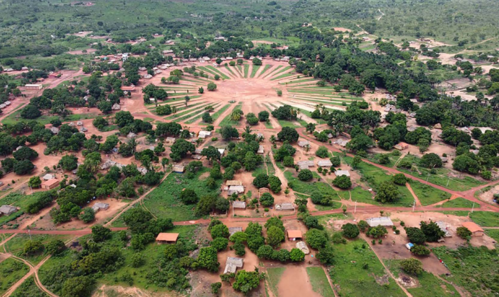
No Cerrado maranhense, a aldeia Porquinhos, da TI Porquinhos, abriga 892 indígenas do povo Canela Apãnjekra. Com estrutura circular típica das ocupações Timbira (tronco Jê), organiza-se em torno de um pátio central, com vias concêntricas e "ruas" radiais. Cercada pela mata, sofre com desmatamento por monocultivos, pastagens, carvoarias. A TI Porquinhos está entre as mais desmatadas do Cerrado