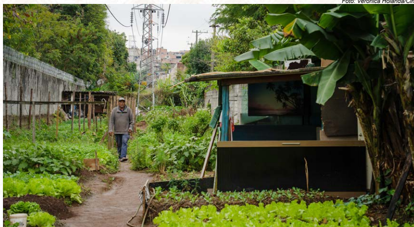
Na Grande São Paulo, cercado por muros acinzentados, hortas cultivadas por indígenas dividem espaço com torres de alta tensão. É a forma encontrada pelo povo Pankararé, em contexto urbano, para garantir seu sustento. Entre verduras, hortaliças e ervas medicinais, erguem-se as estruturas que sustentam os fios. Isolado das demais casas, o terreno costuma ficar vazio e qualquer atividade na área oferece riscos

Invasões de madeireiros e a instalação de grandes empreendimentos colocam em risco seu modo de vida. São povos cuja territorialidade se expressa no deslocamento sazonal por